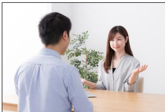
お見合ロールプレイ

またお見合いの時は東京ディズニーランドのパンフレットを持ち込み、話を膨らますパターンも練習しました。これらを ロールプレイ で何度も繰り返しました。